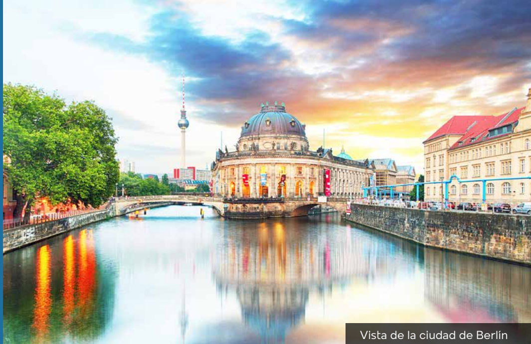
Vista de la ciudad de Berlín