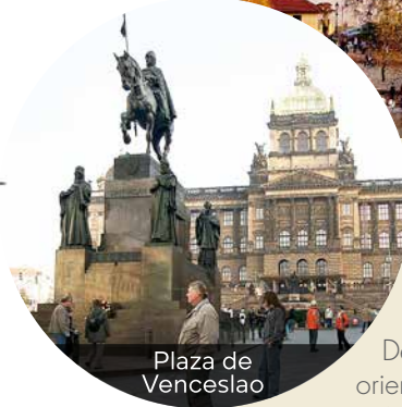
Plaza de Wenceslao