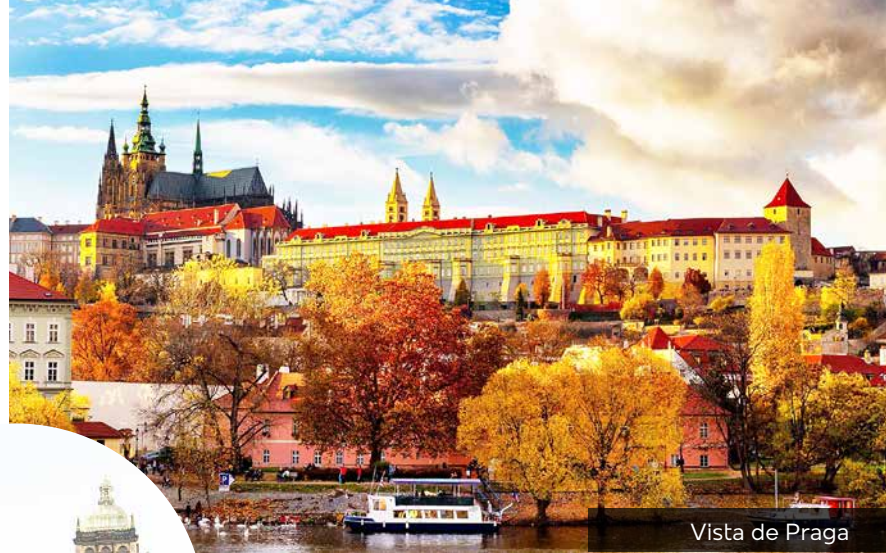
Vista de Praga

Desayuno y día libre donde recomendamos visitar (opcionalmente) la Praga artística y conocer el Barrio del Castillo y el Callejón de Oro. Alojamiento