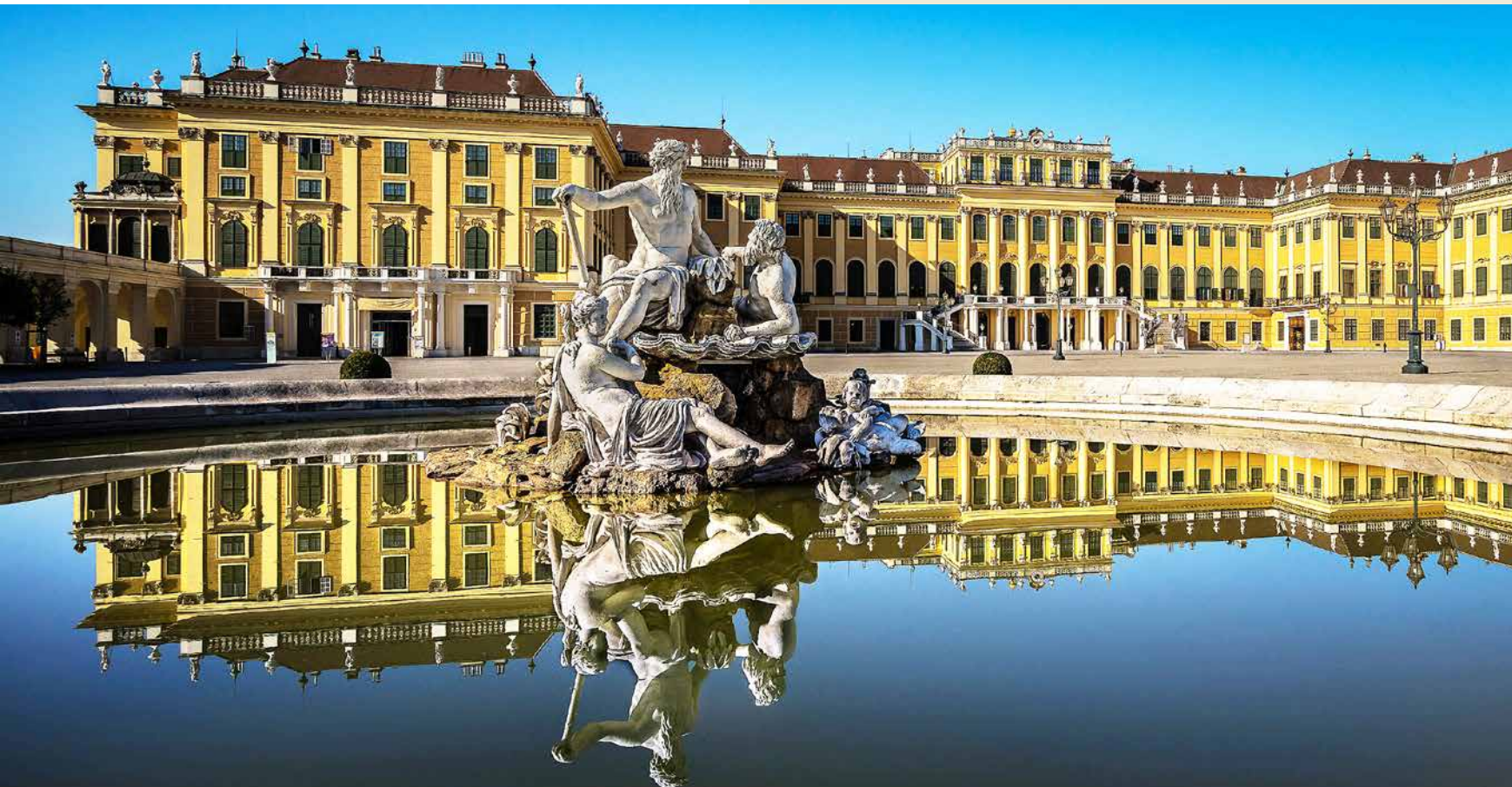
Palacio de Schönbrunn - Viena

Paisajes urbanos llenos de magia que te transportarán en el tiempo.