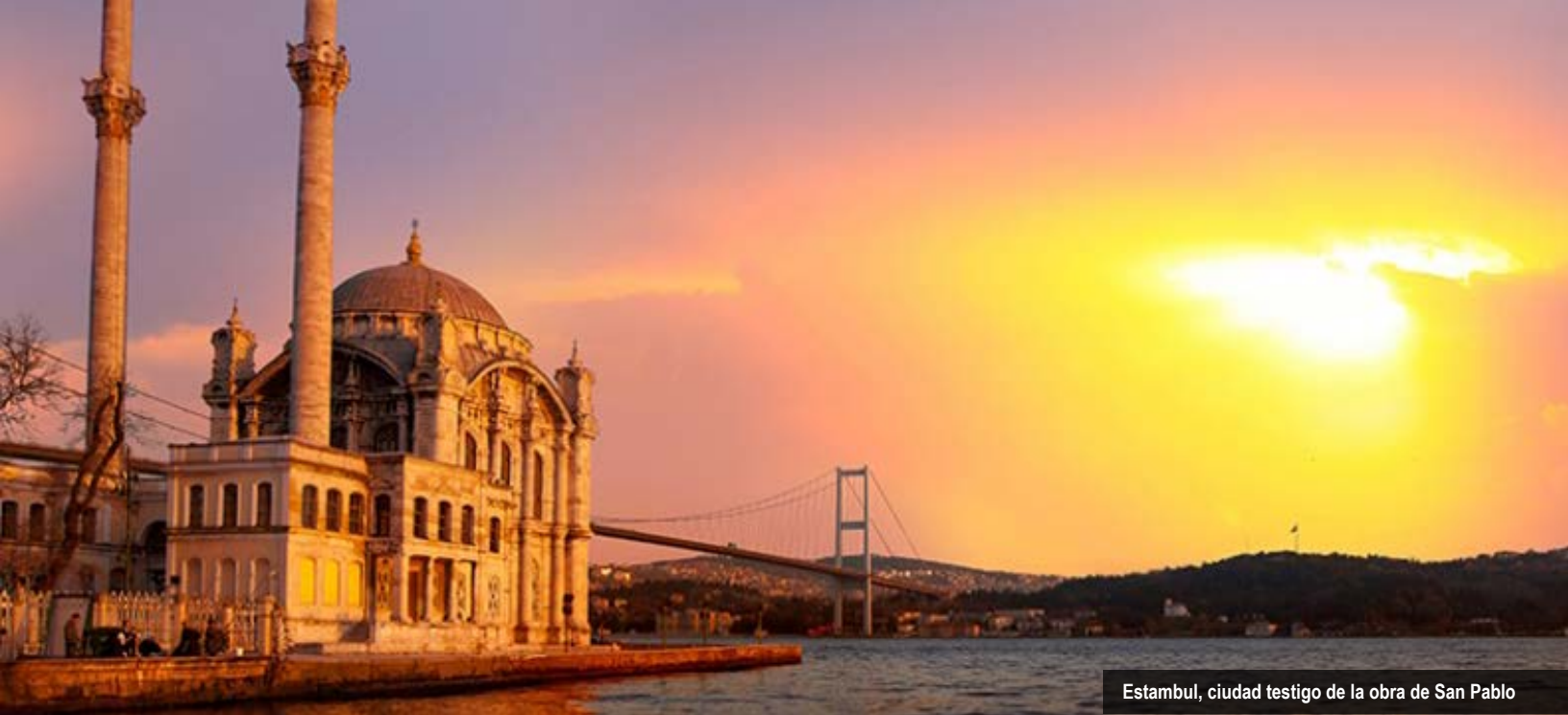
Estambul, ciudad testigo de la obra de San Pablo