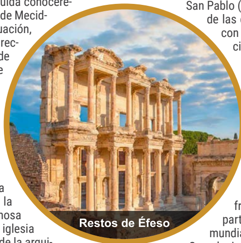
Restos de Éfeso

Visita de día completo a Capadocia. Capadocia es única en el mundo por sus paisajes volcánicos, sus ciudades subterráneas de la época cristiana temprana y sus miles de iglesias enclavadas en la roca con fantásticos frescos. Capadocia está bajo la protección del departamento cultural de la UNESCO como patrimonio mundial. El origen de la vida monástica se remonta a Capadocia donde San Basilio estableció y fomentó la vida monástica, dando lugar a miles de comunidades monásticas durante la era medieval. San Pablo viajó por los alrededores de Capadocia, lo cual explica la existencia de muchas iglesias allí. Almuerzo. La visita incluirá los museos al aire libre de Göreme y Zelve para conocer las iglesias con los mejores frescos conservados. También se visitarán los valles de Üçhisar y Güvercinlik para disfrutar del magnífico paisaje de Capadocia. Viaje en autocar por el pueblo de Avanos, famoso por la alfarería hecha a mano desde los tiempos de los Hititas.